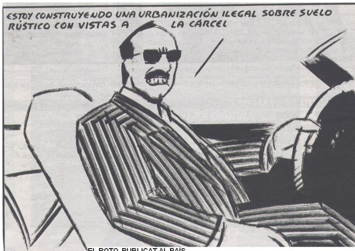
EL ROTO, PUBLICAT AL PAÍS.

Per acabar, l'Ajuntament s'ha mostrat totalment incapaç d'aturar la construcció d'habitatges il·legals