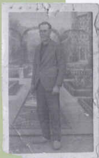
A la presó 1941.