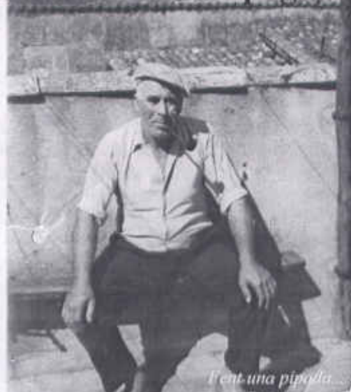
Fent una pipada...

Militant de conviccions anarquistes, no l'i van impedir la seva militància comunista. La seva tenacitat, entrega i disci-